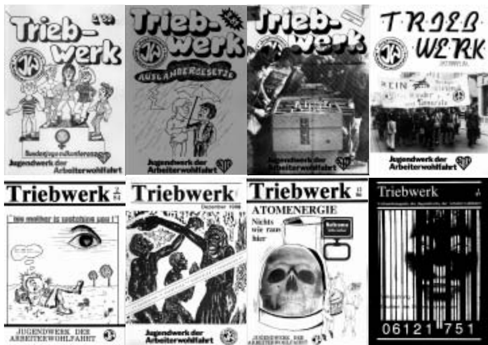
„Triebwerk“-Ausgaben auf einen Blick

JW-Delegation schon fast traditionell am Internationalen Werder-Lager [internationales Jugendlager der FDJ in Werder (DDR) vom 28. Oktober bis 3. November 1987] in der DDR teil, im Dezember bereist eine FDJ-Delegation drei Bezirksjugendwerke.