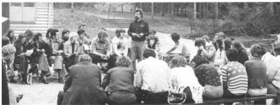
Eröffnung des 1. Bundesjugendwerkestreffes, Grünberg, Mai 1977

In einer der Konferenzdiskussionen ging es um eine Beitragsregelung für das Jugendwerk und die „Verzahnung“ des Jugendwerkes mit der AWO. Es wurden darüber hinaus die Leitsätze,