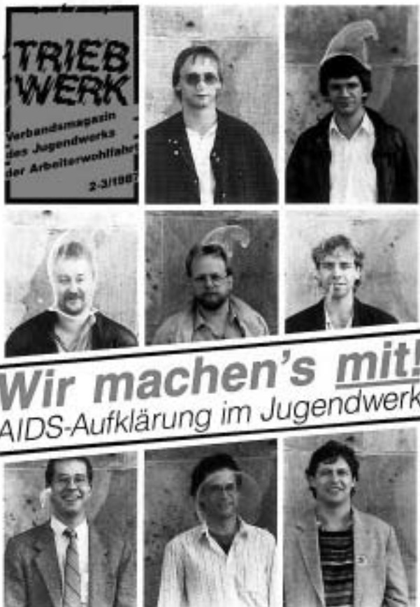
Titelseite, Triebwerk, 2-3/1987

Ein wesentliches Problem der meisten Jugendwerks-Gliederungen war die gescheiterte Aufnahme in die jeweiligen Landesjugendringe, was sie aber nicht daran hinderte, genauso wenig wie das Bundesjugendwerk beim DBJR zuvor, den Aufnahmeantrag immer wieder neu zu stellen.