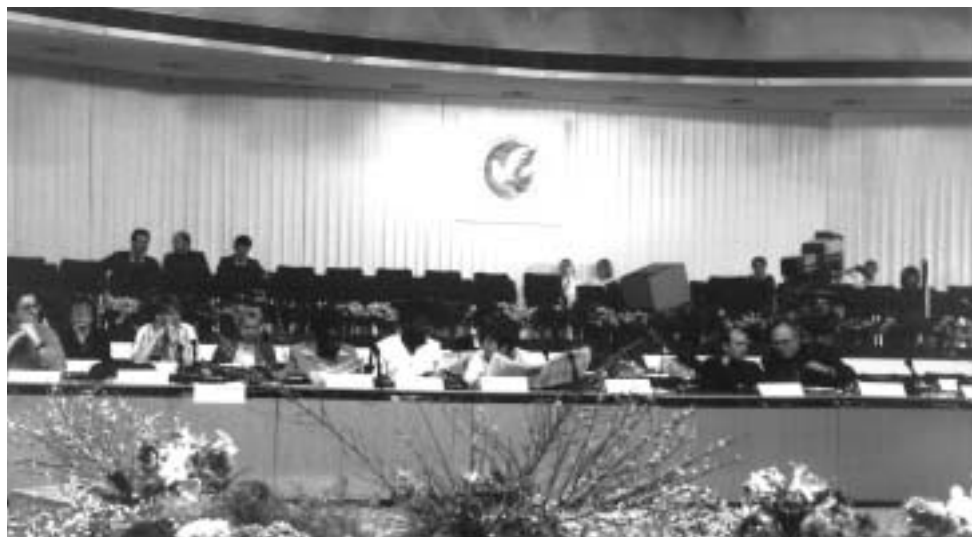
FDJ-Friedensseminar, Ost-Berlin, 1987

JW-Delegation schon fast traditionell am Internationalen Werder-Lager [internationales Jugendlager der FDJ in Werder (DDR) vom 28. Oktober bis 3. November 1987] in der DDR teil, im Dezember bereist eine FDJ-Delegation drei Bezirksjugendwerke.