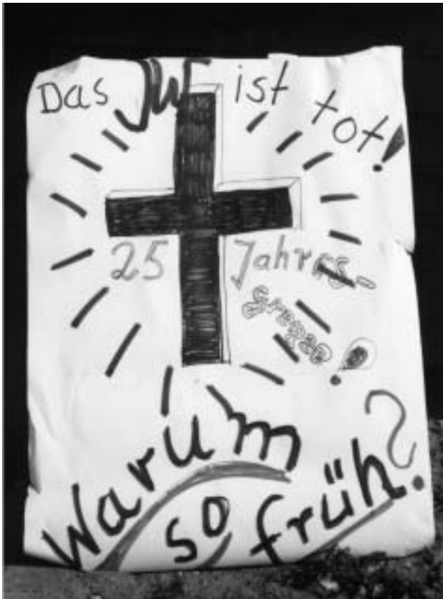
Bundestreffen in Hinsbeck, 1980