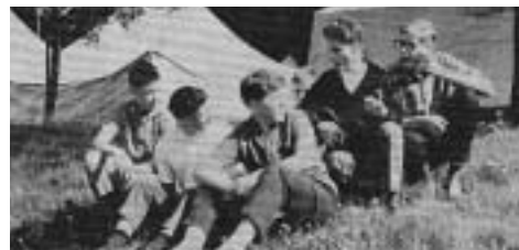
aus: Unsere Arbeit, Juli 1964

Im April 1960 betonte die AWO auf einer „Arbeitskonferenz über Kinder- und Jugendgruppen der Arbeiterwohlfahrt“, „daß die AW-Kinder- und Jugendgruppen in ihren Gruppenprogrammen und in der Art ihres Zusammenlebens in keine Normen gepresst werden dürfen. Jede Gruppe soll Freiheit haben, ihr eigenes Gruppenleben selbst zu bestimmen und zu entwickeln.“