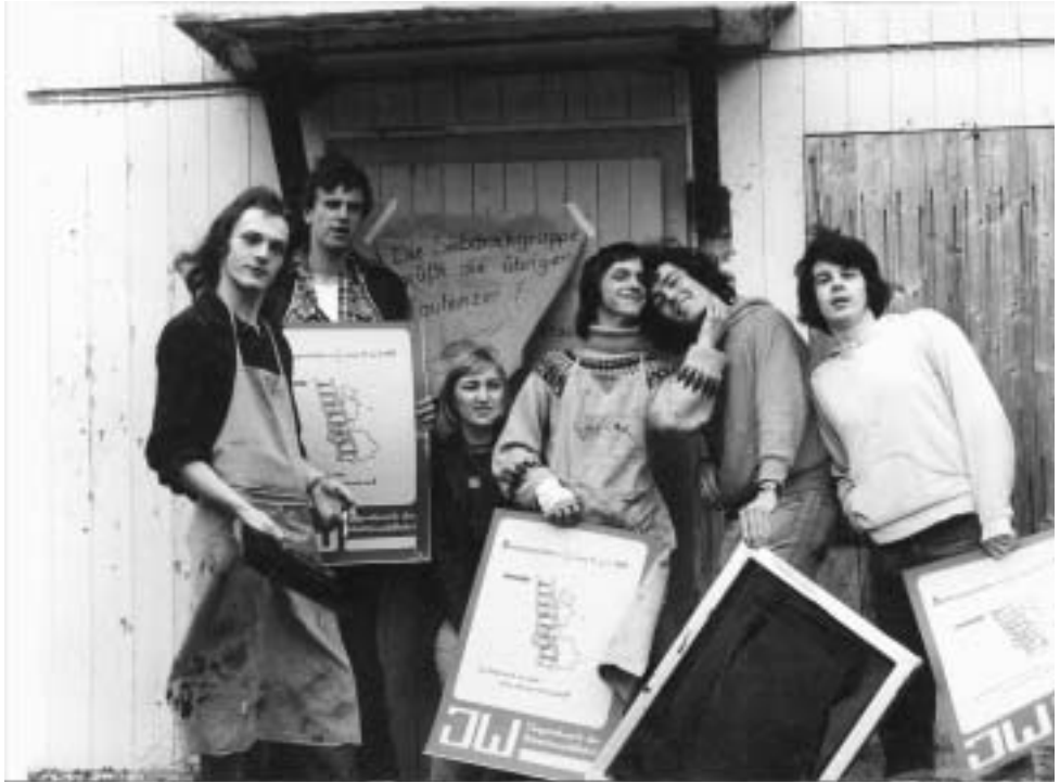
Erstes Bundestreffen in Grünberg

„Von Oben wurde immer wieder der Deckel aufgedrückt, jedoch – der Druck war stärker.“ 25