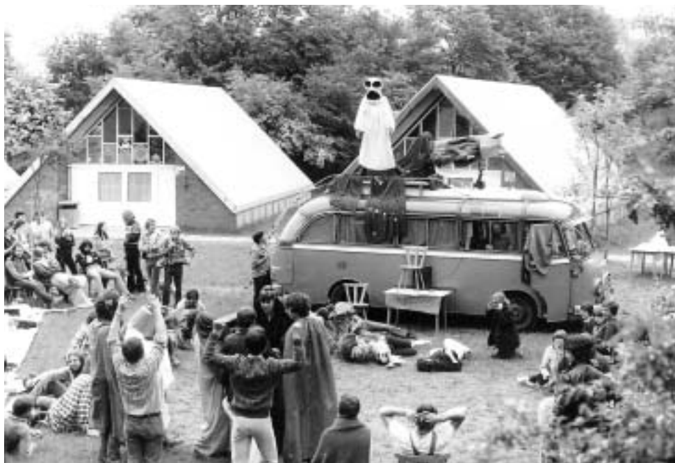
Bundestreffen, Kiel, 1981