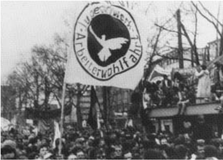
Friedensdemo, Bonn, 1983