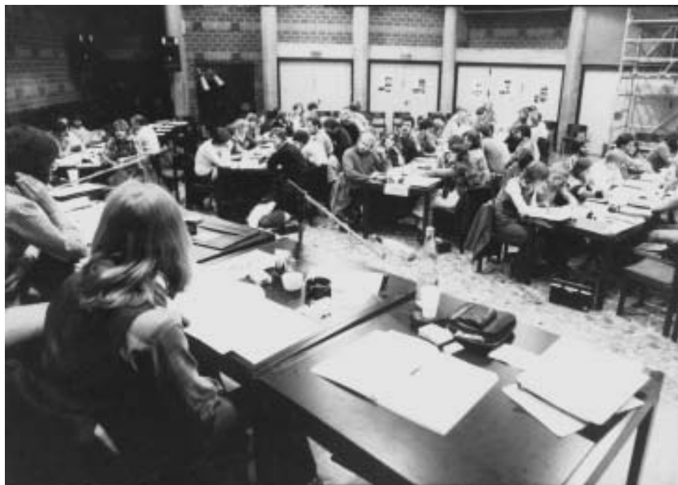
Erste Bundeskonferenz des Jugendwerkes, 1978, Bonn/Bad Godesberg

Ein Resultat der Konferenz war der Paragraph 7 der Satzung der Arbeiterwohlfahrt von 1977 . Dieser Paragraph eröffnete die Möglichkeit für Jugendliche, Jugendgruppen zu bilden, was an sich noch keine Neuerung darstellte, wohl aber, dass diese „ nach der Satzung des Jugendwerkes der Arbeiterwohlfahrt “ arbeiten sollten.