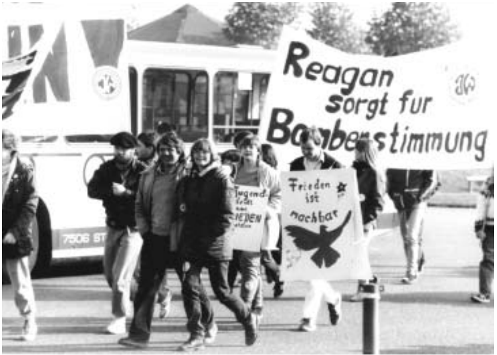
Friedensdemo, Bonn, 1983